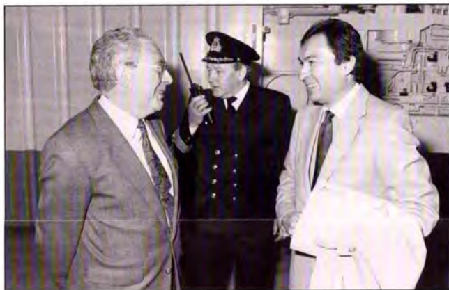
Minister Coëme verwelkomd door Directeur-generaal Depraetere en Commandant De Bruyne.