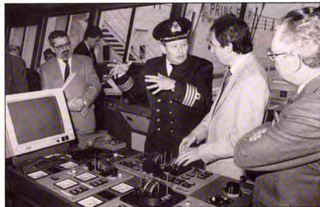
De Minister krijgt uitleg over het navigatiesysteem.

De pers, die beroepshalve toch kritisch ingesteld is, toonde zich evenwel gedurende het bezoek aan het schip opgetogen over de geraffineerde luxe en het comfort aan boord. Ook de ver doorgedreven veiligheidsvoorzieningen en de