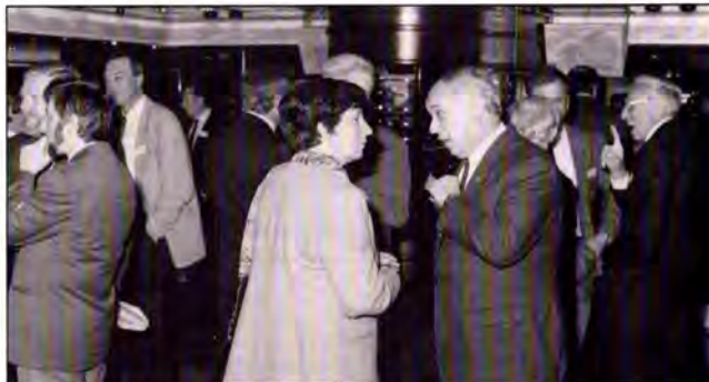
Een inhuldiging met veel personaliteiten. Op de voorgrond de Gouverneur van de provincie West-Vlaanderen.