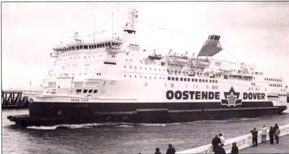
Na de inhuldiging verlaat de „Prins Filip“ Oostende voor een korte trip.